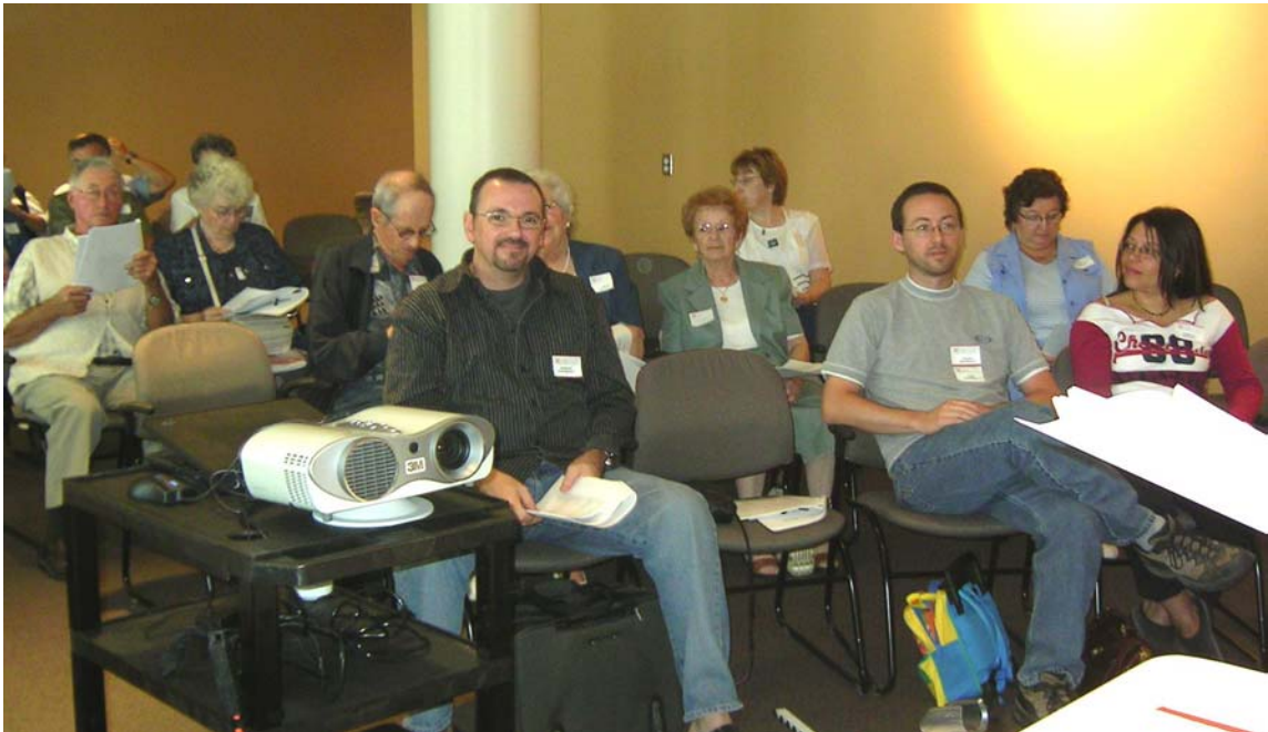
Une partie de l'assistance

Le 7 août dernier la grande famille des Dessureault et leurs ami(e)s avaient rendez-vous au Musée de la culture populaire de Trois-Rivières. Comme activité récréative ou culturelle, le programme prévoyait deux visites : le Musée, puis la Vieille prison de Trois-Rivières.